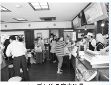
オープン後の店内風景

丸森町商工会は、平成17年度に策定した「商業タウンマネージメント計画策定事業(丸森町TMO構想)」に取り組み、空き店舗の解消を図りながら、観光客を含む丸森町来訪者及び町民がゆつたりと楽しみながら買い物出来る商業環境を整備し、この中心市街地に賑わいを創出するための「構想」を策定したところです。