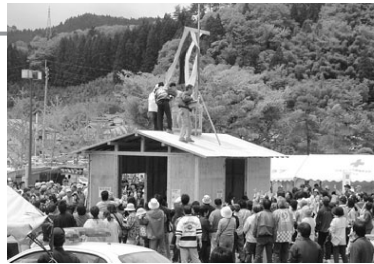
恒例の建設職組合によるミニ上棟式