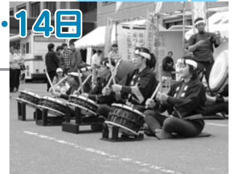
童楽娘鼓による太鼓の演奏

会場は町内の業者を中心に120店が出店し、庭木や花木、ナス、きゅうりなどの野菜苗をはじめ町の特産品が販売され、お目当ての品物を求めて賑わった。イベントとして恒例の建設職組合によるミニ上棟式と、童楽娘鼓 DORAMUSUKO による太鼓の演奏・よさこいの演舞で盛り上がった。